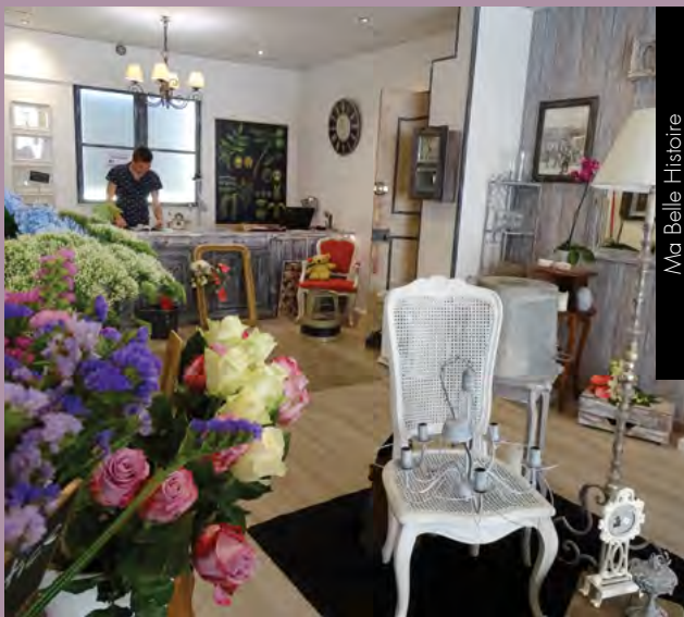
Ma Belle Histoire