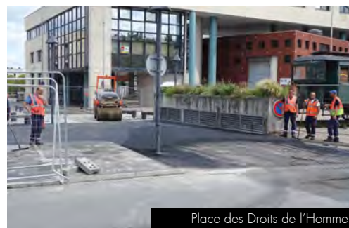
Place des Droits de l'Homme