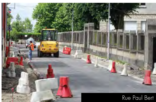
Rue Paul Bert

Le Centre technique municipal a refait la toiture et l'isolation d'un bâtiment de la Direction des Solidarités, rue du Cloître. La remise en peinture des menuiseries extérieures a été confiée à l'entreprise sociale TED. La porte d'accès à ce local abritant des salles de réunion a été remplacée conformément aux normes d'accessibilité. / Maison Marc Sangnier : après la rénovation de la toiture, l'isolation par l'extérieur et la pose de nouveaux bardages entre 2013 et 2015, les façades seront remises en peinture en 2016 par l'entreprise TED.