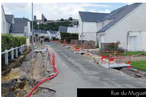
Rue du Muguet